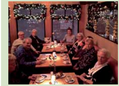
Trouwe huurders uit Heiloo en Egmond kwamen samen in de gezellige Brasserie van hotel Zuiderduin.

De trouwe huurders werden gezamenlijk uitgenodigd om dit feit te vieren onder het genot van een kopje koffie en een gebakje. Het werden gezellige bijeenkomsten waar huurders herinneringen met elkaar ophaalden. Nog steeds wonen de mensen met veel plezier in hun buurtje. Zo vertelt een bewoonster dat haar buurman op haar let, sinds haar man is overleden. Als haar fietsbanden te zacht zijn, houdt hij haar aan en pompt hij haar banden op. Waardevol om te horen dat huurders op deze manier samen leven. De huurders spraken aan het eind hun enthousiasme en waardering uit over deze mini-reünies.