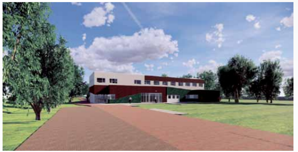
Kantoor in Heiloo voor Kennemer Wonen en Landschap Noord-Holland

Duurzaamheidsmaatregelen Kennemer Wonen draagt het klimaat een warm hart toe. Duurzaamheidsmaatregelen zorgen voor klimaatwinst en voor lagere energielasten. In het voorjaar van 2019 verhuist Kennemer Wonen samen met Landschap Noord-Holland naar een duurzaam, energieneutraal kantoor aan de Schuine Hondsboschelaan in Heiloo. Het pand is de afgelopen periode voorzien van extra zware isolatie, triple-glas, lucht-water-warmtepompen en op het dak liggen ruim 270 zonnepanelen. Ook heeft het pand geen gasaansluiting. Allemaal maatregelen die eraan bijdragen dat het kantoor straks volledig energieneutraal is. Ervaringen die worden opgedaan, kunnen in de toekomst wellicht worden gebruikt om verder door te voeren binnen het woningbezit.