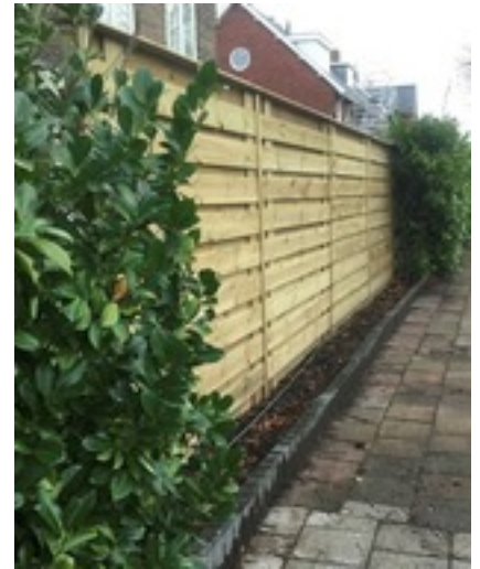
Een nette schutting als erfafscheiding