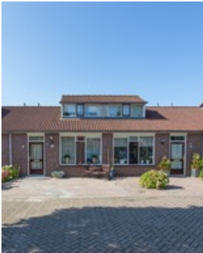
Een visitekaartje van de woning en de buurt